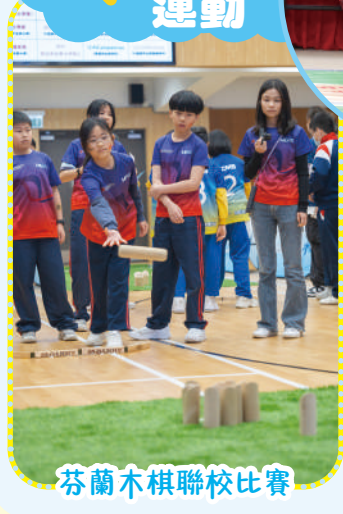
芬蘭木棋聯校比賽