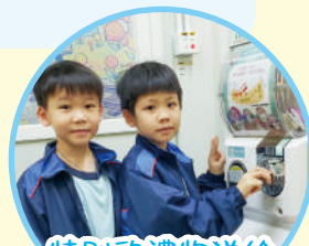
特別的禮物送給 大有進步的你

加強同儕、師生，以及家長與子女之間的關係，提升聯繫感；幫助學生明白自己在不同關係的角色及其重要性，願意承擔責任並作出貢獻。