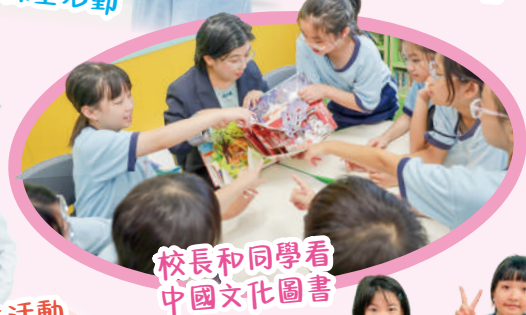
校長和同學看中國文化圖書